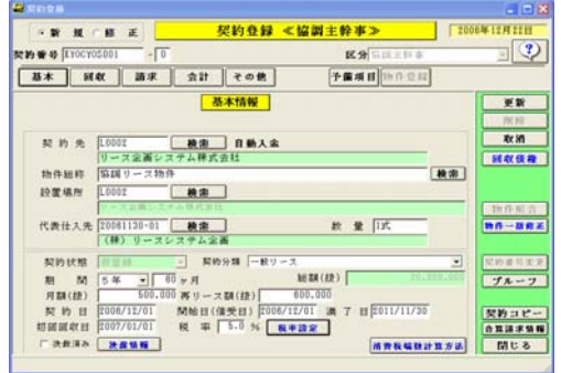
画面サンプル (契約登録・注記)