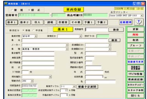
画面サンプル（自動車関連帳表出力メニュー）